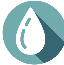
ENERGIA IDRAULICA HYDRAULIC POWER