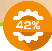
ENERGIA MECCANICA MECHANICAL POWER

Sostituire il motore a combustione con una batteria è una soluzione soltanto parziale