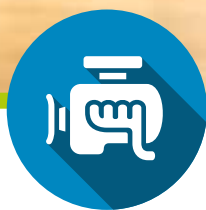
ENERGIA TERMICA THERMAL POWER

Hydrostatic engine powered machines, by their nature, are energetically dispersive: in fact, the already inefficient transformation from thermic to mechanical energy adds the use of an hydraulic circuit that further reduces the yield.