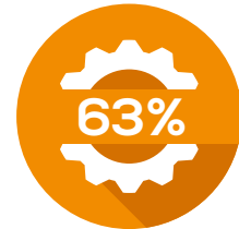
ENERGIA MECCANICA MECHANICAL POWER

Il segreto delle spazzatrici Tenax, fulcro del nostro successo, risiede proprio nell'efficiamento energetico: la corrente elettrica accumulata nelle batterie alimenta direttamente gli organi meccanici tramite motori elettrici a corrente alternata, senza passaggi intermedi.