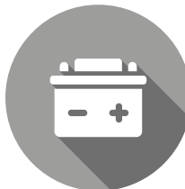
ENERGIA ELETTRICA ELECTRICAL POWER

Replacing the engine with a battery is just a partial solution.