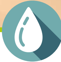
ENERGIA IDRAULICA HYDRAULIC POWER