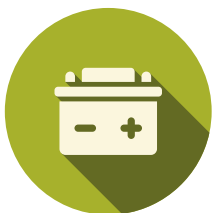
ENERGIA ELETTRICA ELECTRICAL POWER

The secret of Tenax sweepers, the core of our success, lies precisely on energy efficiency: the electricity accumulated in the batteries directly supplies the mechanical organs of the machine through electric motors with no extra energy transformation.