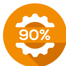
ENERGIA MECCANICA MECHANICAL POWER

Meno sprechi permettono una minore richiesta energetica della macchina, con una conseguente maggiore autonomia e diminuzione dei costi operativi e di manutenzione.